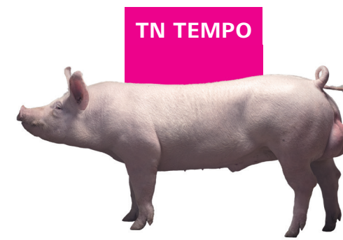
Eber der Large White-Rasse

Der robuste Endstufeneber für eine arbeitseffiziente und einfache Produktion. Das Zuchtziel des TN Tempo ist für Erzeuger konzipiert, die einen schnellen Durchsatz im Stall und Effizienz bei mittleren oder schweren Verkaufsgewichten, in Kombination mit einem relativ mageren Schlachtkörper fordern.