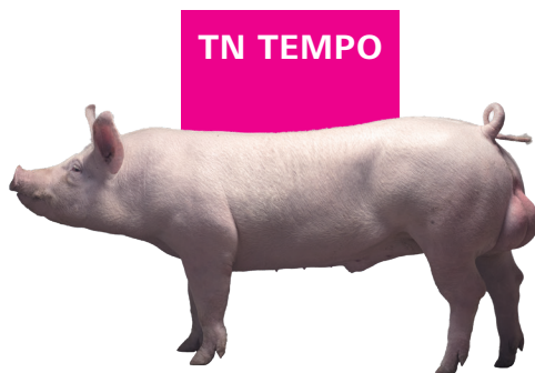
Eber der Large White-Rasse

Der robuste Endstufeneber für eine arbeitseffiziente und einfache Produktion. Das Zuchtziel des TN Tempo ist für Erzeuger konzipiert, die einen schnellen Durchsatz im Stall und Effizienz bei mittleren oder schweren Verkaufsgewichten, in Kombination mit einem relativ mageren Schlachtkörper fordern.